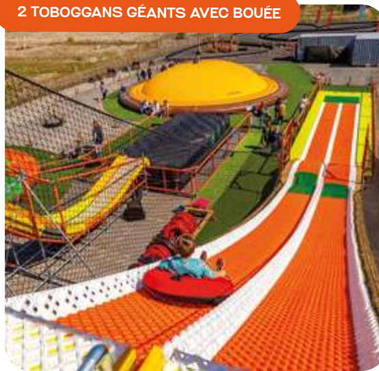
2 TOBOGGANS GÉANTS AVEC BOUÉE

Cet été des animations sportives seront proposées par le Village aventures. Les détails seront à retrouver sur la page Facebook dédiée : Village Aventures Honfleur .