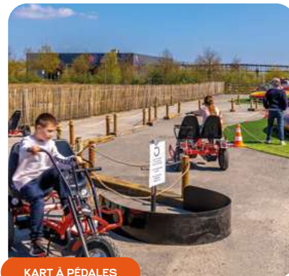
KART À PÉDALES